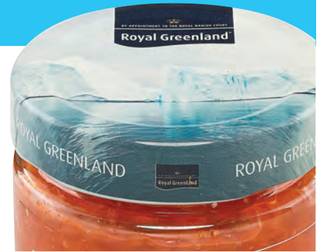
100 g Glas