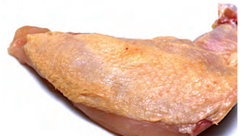
mit Knochen, je Filet 160 - 180 g, 2 Stück pro Packung, Filet de pintade suprême, 160 - 180 g