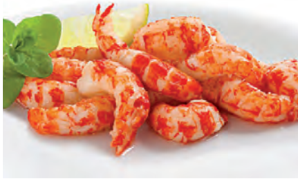
entdärmt, gekocht, Queues d'écrevisses cuites, nettoyées, 10 x 1 kg Bt.