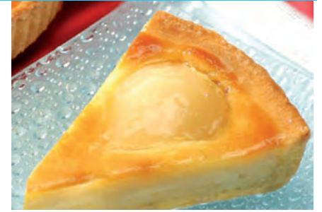
900 g Stück, von Brioche Pasquier