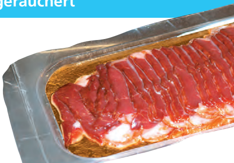
geschnitten, 90 g Packung