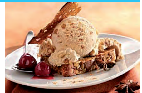
Crème glacée pain d'épices, Kanister 2,5 ltr.