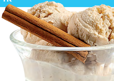
Crème glacée cannelle, Kanister 2,5 ltr.