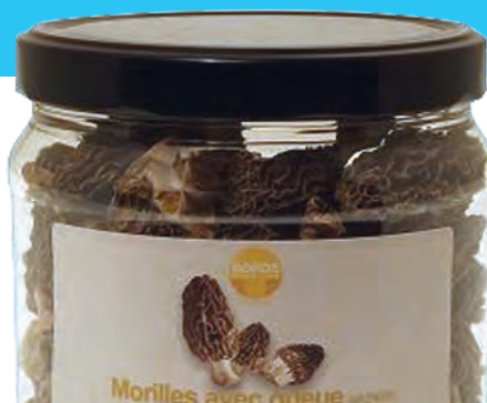
Glas 100 g