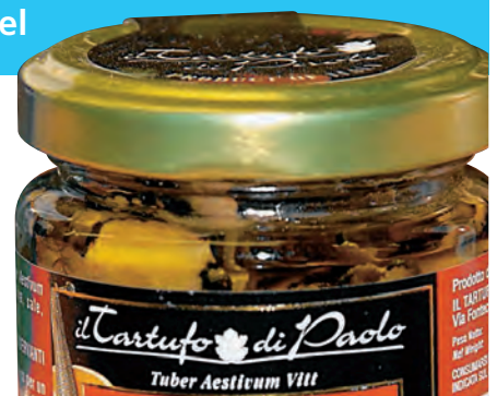
Glas 80 g